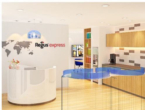
リージャスエクスプレス阪急茨木市駅のエントランスイメージ