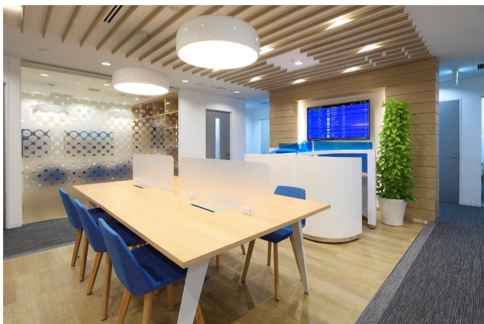
レンタルオフィス「リージャスエクスプレス」のオフィスイメージ