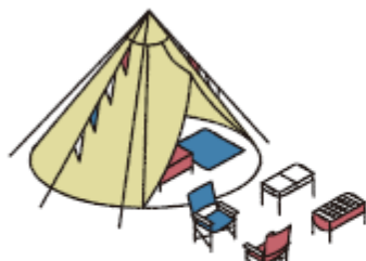
テント・バーベキューセット