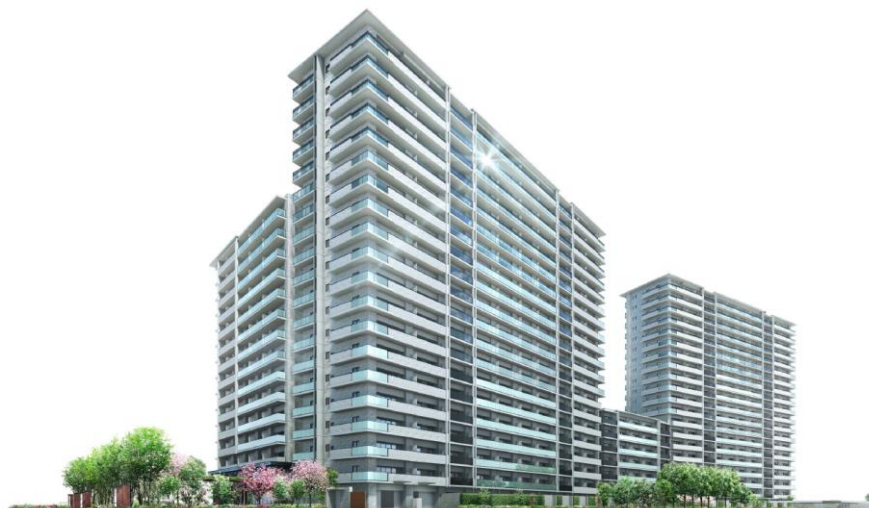
「ジオ福島野田 The Marks」完成予想図